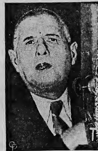
GENERAL Charles de Gaulle tells a press conference in Paris that France should try to halt, through international negotiation, the war in Indo-China. He took exception to the recent dismissal of Marshal, Alphonse Pierre Juin and urged more serious consideration of the deadly potential of the H-bomb.